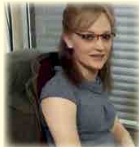
Joné se troosdiens vind plaas Saterdag 6 April, 11:00 vanuit die NG Kerk Moedergemeente Heilbron. Sy laat na haar broer en sy gesin. Baie sterkte aan die familie.