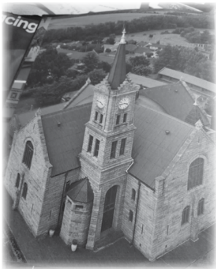
Frankfort se pragtige NG Kerk in die middel van die dorp met sy 34m hoë toring.