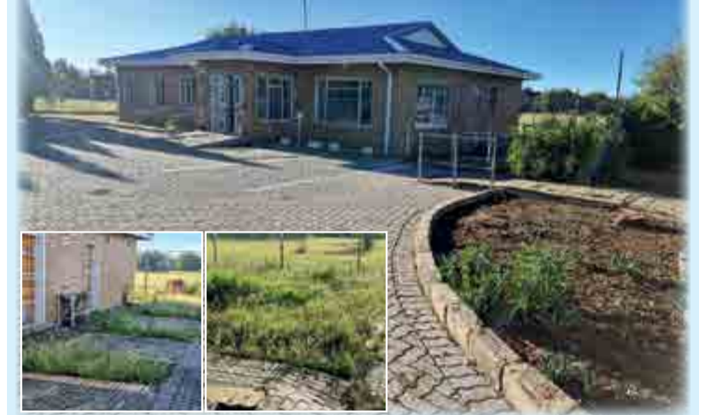
Heilbron Kliniek wil graag AfriForum en Eben Stander met sy span bedank vir die skoonmaak van die tuin. Dit word opreg waardeer.