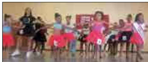
Modelle se gesamentlike deelname aan groeplindans.