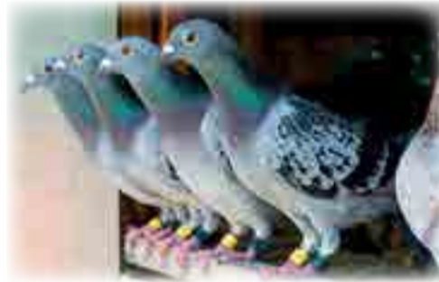
7. F Viviers, 8. D Cilliers, 9. Zenith B, 10. Zenith B.

Ons laaste uitgawe vir die jaar is DV 15 Desember 2023 en eerste