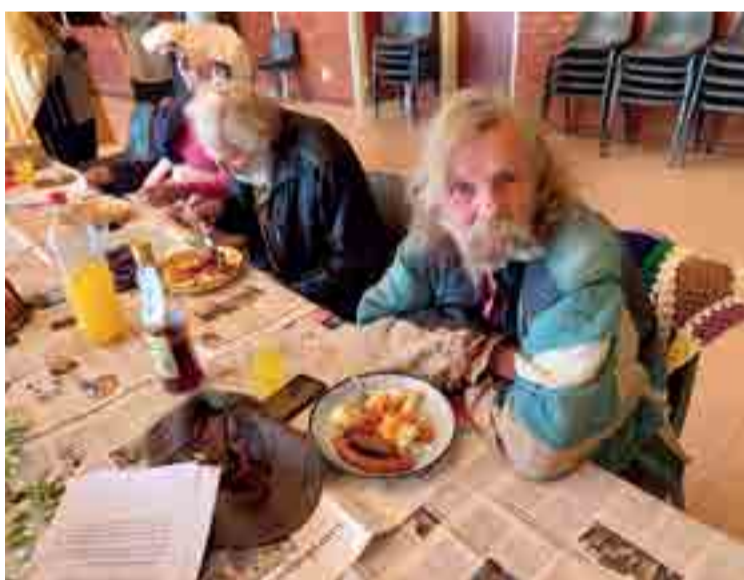
Op 26 Augustus het Edenville Bejaardeklub 'n boemelaarsdag gehou. Die lede het soos boemelaars aangetrek en het selfs uit blikbekers en borde geëet. Dit was 'n heerlike dag en almal het lekker gekuier.