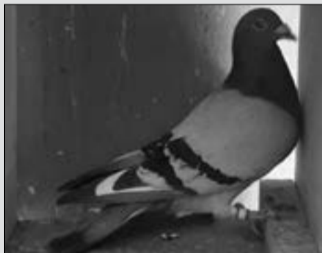
Op die foto bo 1501 van Spartan Pigeons wat Hanover Ope 1 met 4 sekondes gewen het. Foto regs: Hannes Swart van Heine Resiesduif Hokke met nommer 20140 wat Hanover Ope 2 met 4 sekondes gewen het.