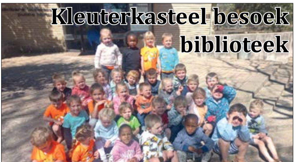
Kleuterkasteel se maaitjies het 'n leersame uitstappie na Heilbron se biblioteek onderneem. Kleuters is uitgenooi om te kom aansluit as hul nie lid is nie.