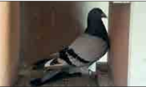
Op die foto is 3729 van Spartan Pigeons wat Hanover Ope 1 met 14 sekondes gewen het. Op foto onder is 419 van Wolmarans Hokke wat Hanover Ope 2 met 33 minute gewen het. Geluk aan Wolmarans Hokke met die groot wen met 33 minute.

Eerskomende Saterdag is 'n oop naweek en die Saterdag daarna vlieg die duiwe vanaf Drie Susters die Ope Kampioenskap en Veiling vlug.