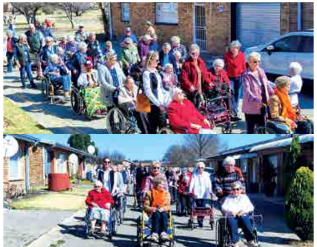
Die Huppel Trippel Klub het Dinsdag hulle tweede rolstoel stap-dag gehou. Die son het saggies geglimlag en die wind het gewag tot die stap verby was. Sô het die natuur bygedra tot nog 'n vreugdevolle saamkuier-oggend. Die rolstoelryers en -stoters het dit eweveel geniet. By die 'pitstops' is heerlike verversings geniet. Op 12 September word 'n varsgebraaide boereworsbroodjie te koop aangebied. Tussendeur sal jukskei en volleyball gespeel word en kettie geskiet word.