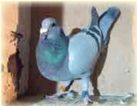
Op foto is nommer 368 van Du Plessis Hokke wat die Hanover Jaaroud vlug met 23 sekondes gewen het.

Eerskomende Saterdag vlieg die duiwe vanaf Richmond.