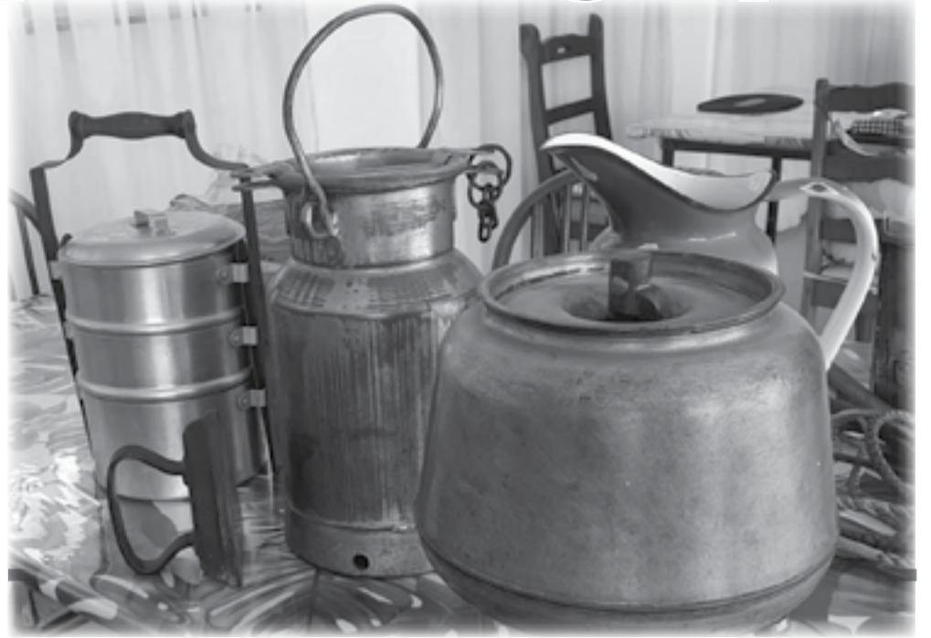
Op die foto 'n "skaf-tin" wat veral die boere gebruik het, 'n strykster, melkkan, botterkarring en lampetbeker.