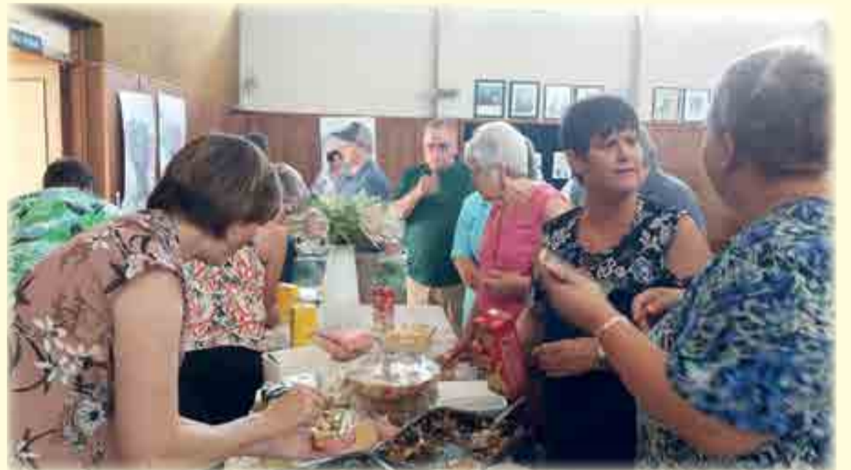
Na baie beplanning het die NG-Kerk Moedergemeente weereens 'n suksesvolle basaar gehou. Die basaar het die 4de Maart plaasgevind; daar was die heerlikste sosaties, poeding en pannekoeke. Kinders kon hulself besig hou by die kindertafel terwyl hul ouers heerlik aan eetgoed smul en die saamkuier geniet.