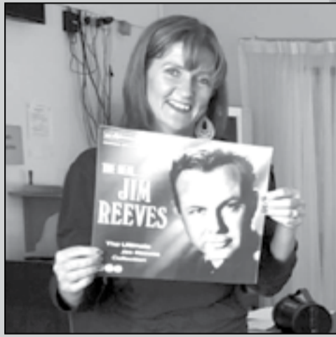
Foto regs van die lede van die Huppel Trippelklub.