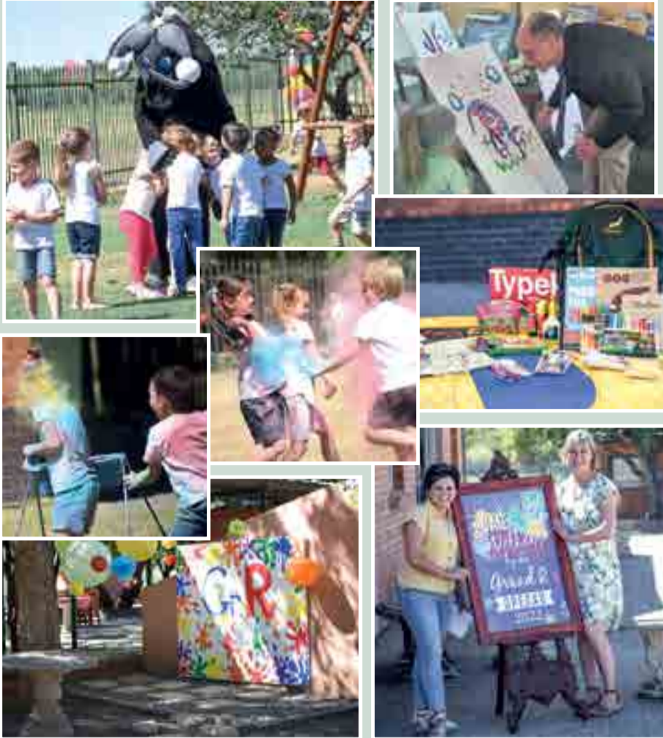
Wat 'n suksesvolle en prettige dag!! By Hoërskool Heilbron is dit 'n fees! Die kleintjies weet verseker dat hierdie die plek is om groot te word! "Ouers van 2023 ons is reg om julle boompies te versorg!"