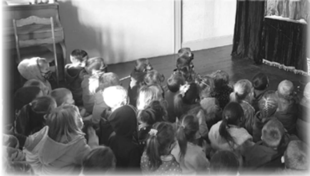
Die kleuters van Kleuterkaasteel Heilbron het na 'n poppekasvertoning gekyk op Woensdag 30 Junie 2021. Die tema was Die Stoute Krokodil! Die kinders het meer geleer van gehoorsaamheid en almal het dit terdeë geniet en sien uit na die volgende vertoning.