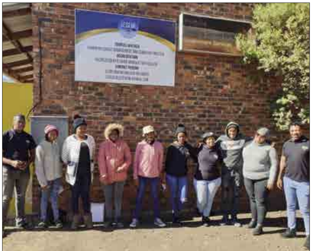
On the photo above members and students in front of training centre in Phiritona.

Lesedi Tele Centre is helping to make dreams come true. As part of Mandela Month they enrolled five students from needy families in Phiritona to free education at their centre. Elias