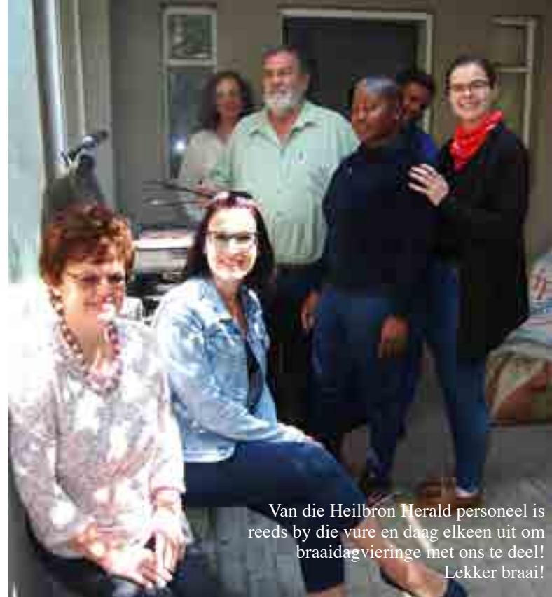
Van die Heilbron Herald personeel is reeds by die vure en daag elkeen uit om braaidagviering met ons te deel! Lekker braai!