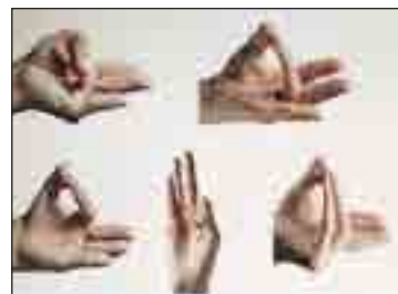
Vyf Joga-oefeninge om rustig te word.

’n Maklike manier is die hand-oefening bekend as Mudras (in joga) wat jou help om te ontspan. Mudras word gedoen in samewerking met asemhalings-oefeninge wat die energievloei deur die liggaam reguleer.