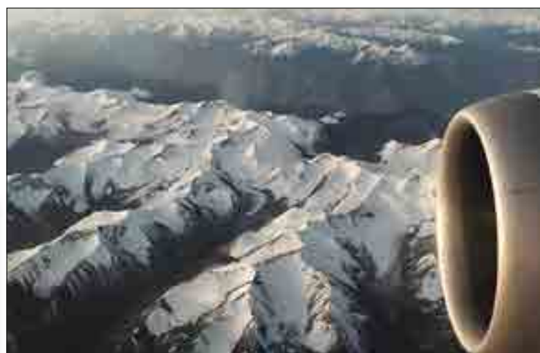
Sonsopkoms oor die Himalajas.