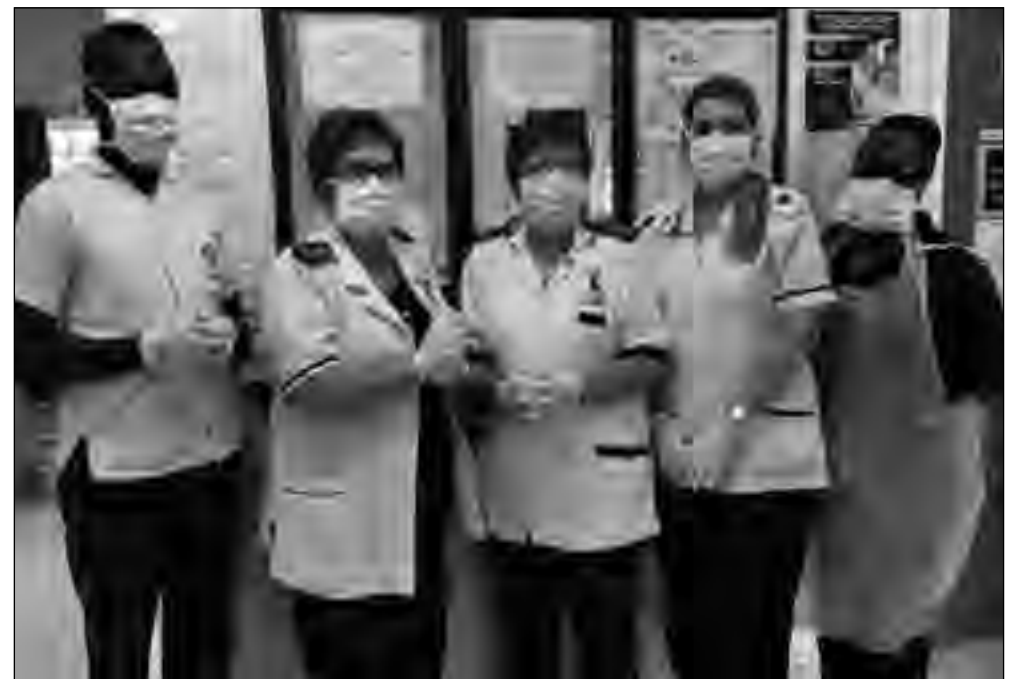
Op die foto bo van die personeel van Heilbron Kliniek.

Ons vra dat almal die nuwe voorsorg maatreëls sal nakom en om veilig te wees.