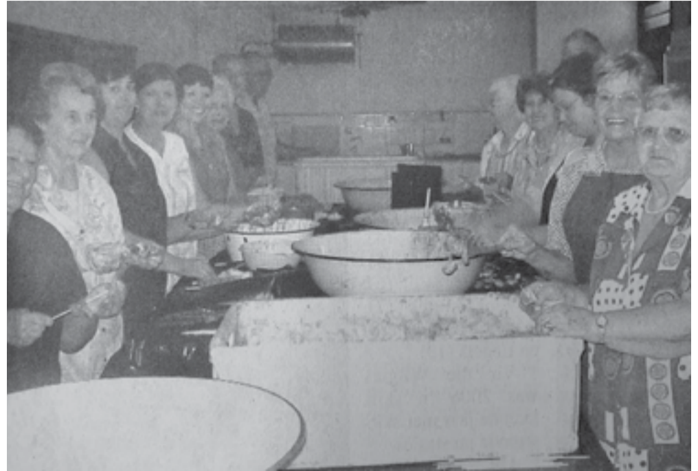
Heilbron Herald, 16 Maart 2007

VLEISWERK OP GROOT SKAAL: Dinsdag het NG Moederkerk se ywerige lidmate sosaties gemaak. Die sjaal was deurtrek van 'n aangename kerriereuk. Al die Heilbronniers behoort dit te geniet as hulle Saterdag, 17 Maart tydens die basaar die sosaties gaan beproef.