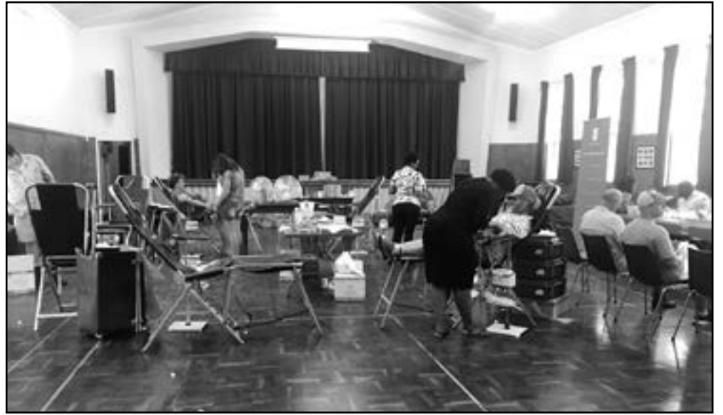
Op die foto bo is van die skenkers besig om bloed te skenk.