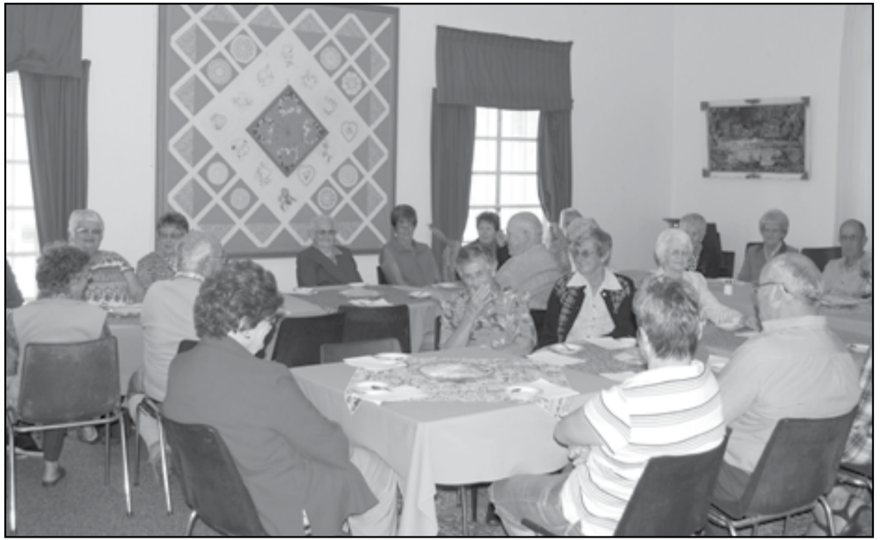
Die Heilbron Dienssentrumlede is hierdie week lekker bederf met sop en brood na die heerlike reën die afgelope tyd. Dit is die laaste byeenkoms wat die lede het vir die kwartaal. Daar was lekker gesels deur mekaar te herinner oor die wonder van God se Skeppings, so ook die dinge wat mens elke dag nie raak sien nie. Die Dienssentrum sal weer op 16 April begin vir die tweede kwartaal.