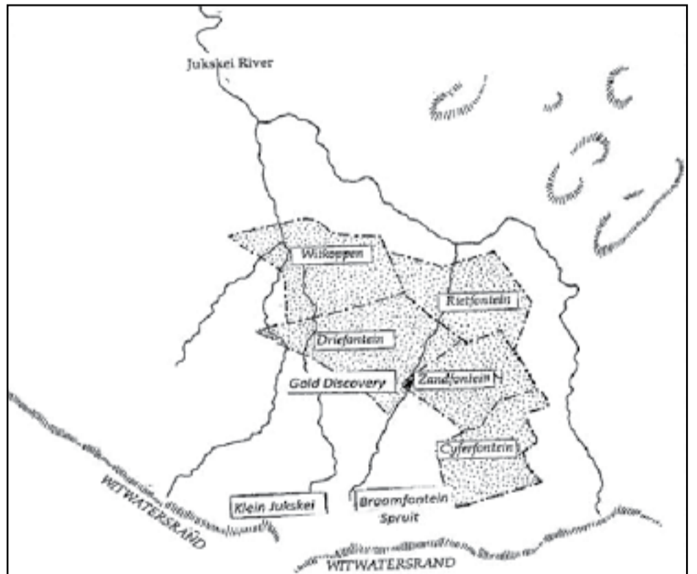
Kaart van plase Wikiwand.

Bronne - dankie aan Oranjeville Biblioteek, Onder die Bodem van die Vaaldam, Randwater, Lulu Engelbrecht navorsing, L.C.J. Dreyer se vertelling deur Piet van Rooyen en RAU. Bronne van kinders verkry by Genealogy so ook die fotos en sterfte sertifikate van Roetse.