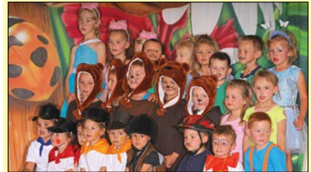
Kleuterkasteel se kleuters is weereens hul ouers en onderwysers se trots. Op 10 November 2018 het die konsert, Speelgoedland, gesorg vir lekker vermaak by die Suid-kerk. Die konsert was 'n reuse sukses en die ouers het dit terdeë geniet.