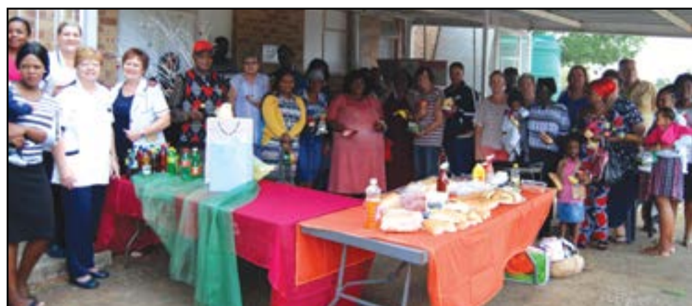
Die Gesondheidskomitee van Heilbron Kliniek het 20 November 'n kersprojek aangebied vir die pasiënte. Hulle het gesmul aan heerlike worsbroodjies en lekkernye. 'n Gesellige atmosfeer het geheers en 'n Gesoënde Christusfees is almal toegewens. Personeel van die kliniek wil die komitee bedank vir hulle liefdevolle en onbaatsugtige diens en hulp gedurende die afgelope jaar. Voorwaar 'n goeie span om mee saam te werk.