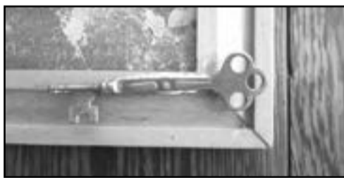
Sleutel van eerste opstal.