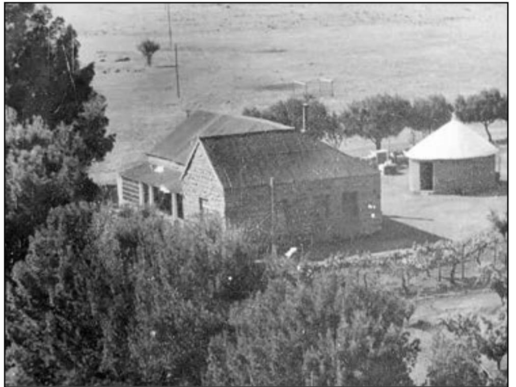
Diericksdam eerste opstal.

Met die onteiening van die plase in 1934,