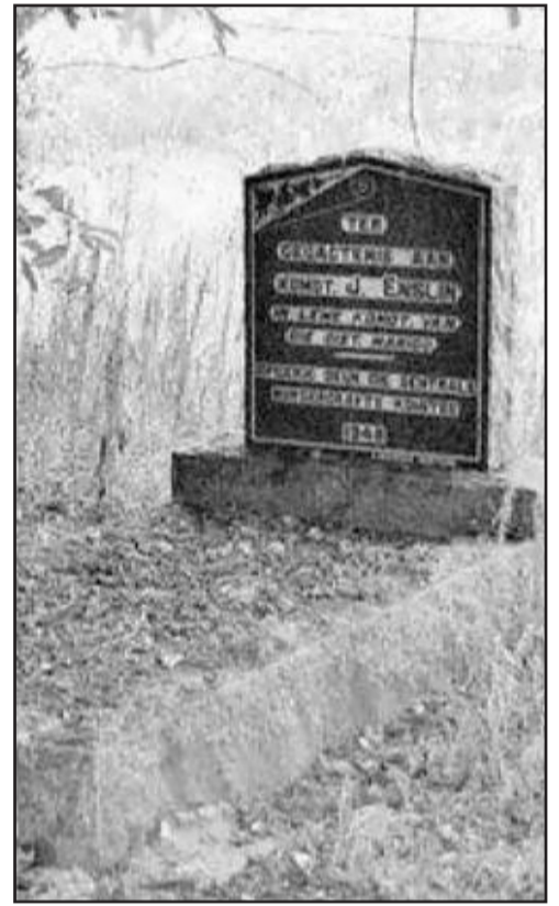
Graf van JA Enslin by Marico

Die dorp Nylstroom is toe aangelê op die