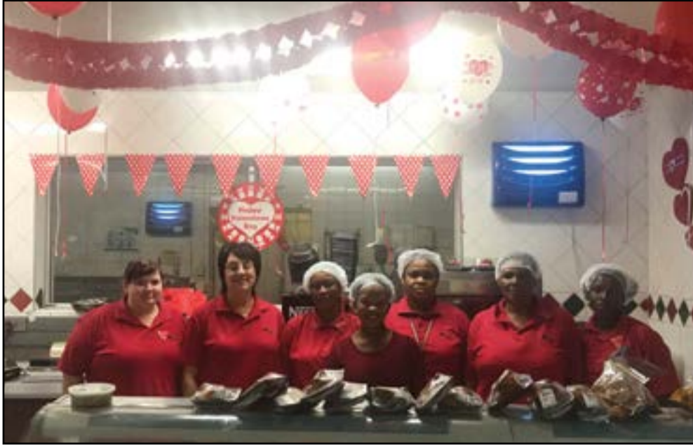
'n Gelukkige Valentynsdag is elke kliënt toegewens van die OK se deli personeel af. Hoe rooier, hoe mooier!