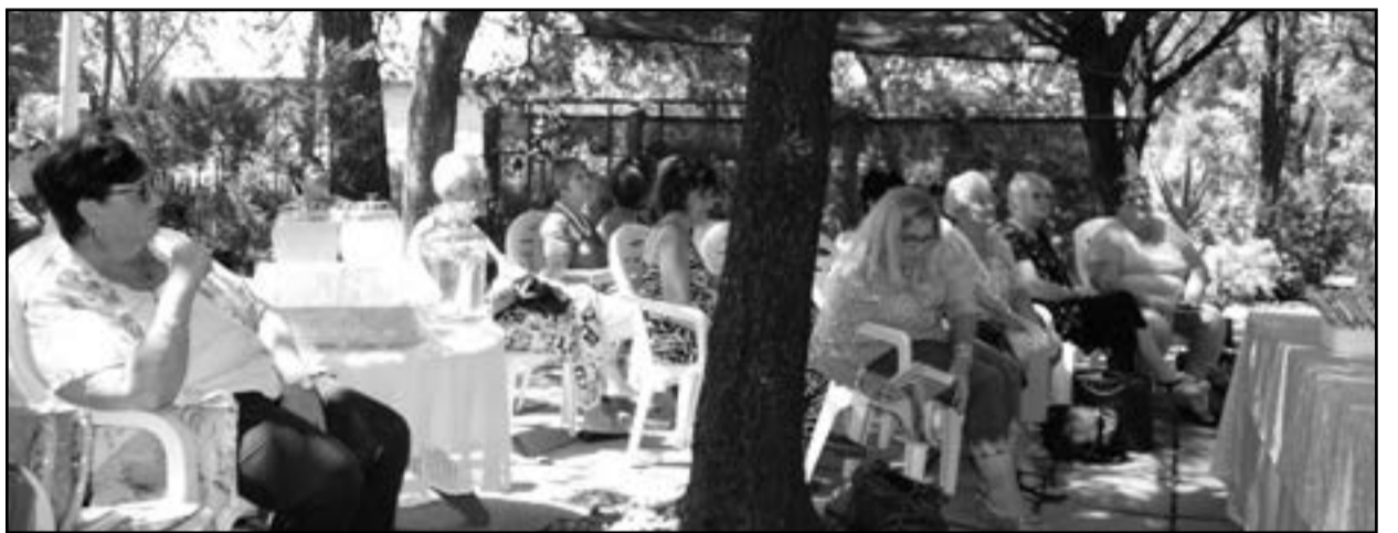
Op die foto bo van die Tuinboulede wat aandag sit en luister.

Augustusmaand kan die volgende toediening plaasvind. Volg die duidelike instruksies agter op die voedingsverpakking voor toediening. Clivias moet in wintermaande slegs een keer 'n maand met ligte sproei op hul blare water kry. In die somer kan hulle diepwater kry, ongeveer elke tweede week.