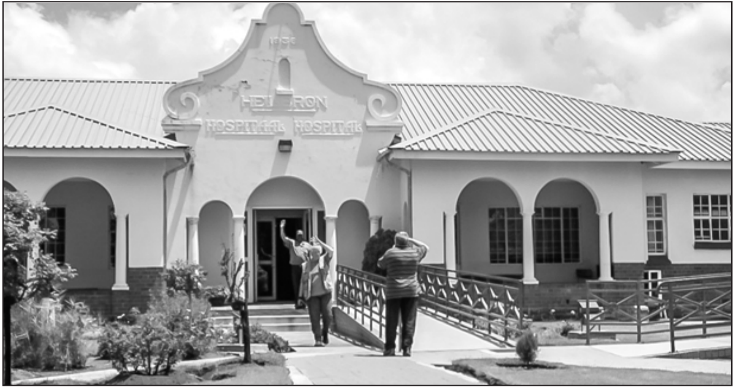
Tokollo Hospitaal, ou vooraansig behou.