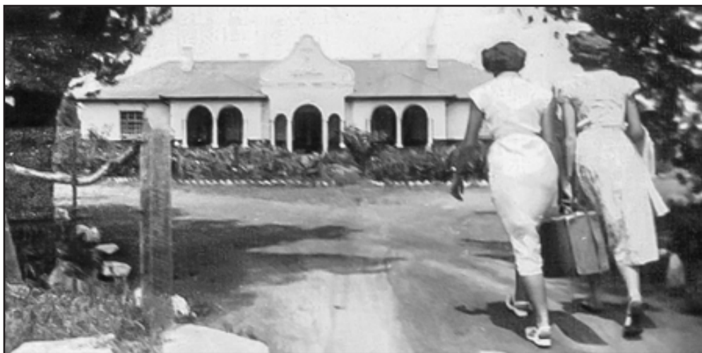
Ou Heilbron Hospitaal.